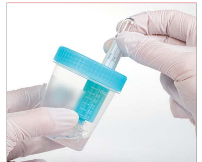
Transfert clos de la salive par vide.