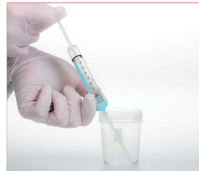
Recueil sûr de l'échantillon de salive par aspiration.