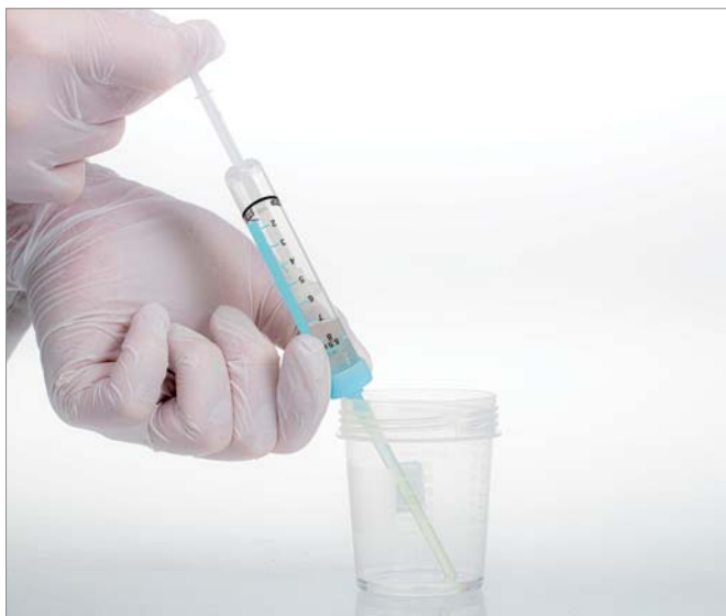
Sicheres Aufziehen der Speichelprobe mit der Aspirationstechnik.