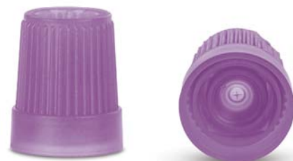
Microvette® APT 250