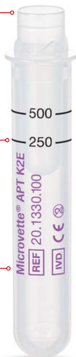
Microvette® APT 500

Экономия времени при анализе – гигиеничное взятие непосредственно из первичной пробирки.