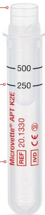
Microvette® APT 500

Экономия времени при анализе – гигиеничное взятие непосредственно из первичной пробирки.