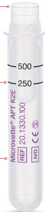
Microvette® APT 500

Zeitsparende Analytik – direkt und hygienisch aus dem Primärgefäß. Neu entwickelter Membranverschluss gewährleistet gleichzeitig sicheren Transport und Versand der Probe.