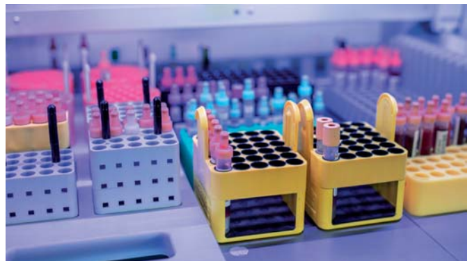
Automatische Ausgabe im Rack