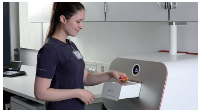
Mehrfacheingang für bis zu 25 Proben gleichzeitig.