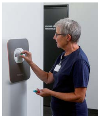
Die Probenröhrchen werden in der Eingabeöffnung der Vita-Station platziert.