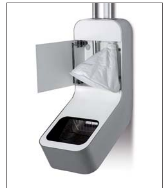
Filterbeutel zur Reinigung