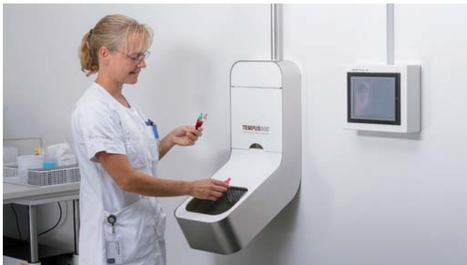
Die Proben kommen in der Empfangsvorrichtung an und können dort entgegengenommen werden.