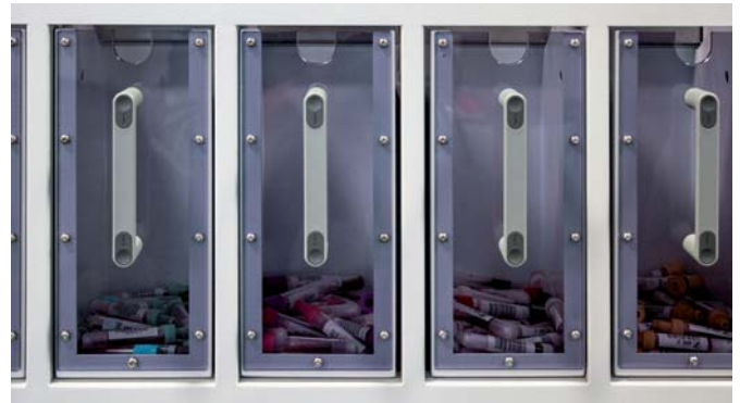
Verteilen in Zielboxen

Tempus600®, kombiniert mit dem Bulk to Bulk Sorter HCTS2000 MK2, vereinfacht die Arbeit im Probenzugang deutlich. Das Gerät registriert und sortiert geschlossene Probenröhrchen als Schüttgut anhand des Barcodes (Materialcode) oder nach Vorgabe des Labor-Information-Systems (LIS) in verschiedene Zielfächer. Bei Verwendung einer Kamera (optional) ermöglichen Plausibilitätskontrollen das Auffinden und Aussortieren von Fehlerproben. Arbeitsabläufe beim Eingang der Proben im Klinisch-Chemischen Labor oder in der Hämatologie lassen sich auf diese Art weiter optimieren und so die Durchlaufzeiten für Proben verkürzen.