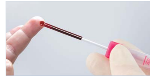
Microvette® 100/200 – End-to-End kılcal tüplerle kan alımı

Microvette®, end-to-end kılcal tüplerle ve kan alma kenarıyla kan alınmasını sağlar veya kan toplama tüpü olarak kullanılabilir.