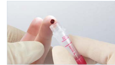
Microvette® 300/500 – Kan alma kenarıyla kan alımı