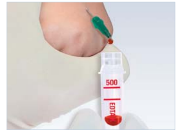
Microvette®, kan toplama tüpü olarak