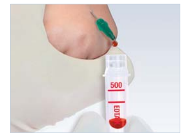
Microvette® ως φιαλίδιο λήψης σταγόνων