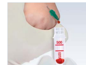
Microvette® ako skúmavka na kvapkajúcu krv