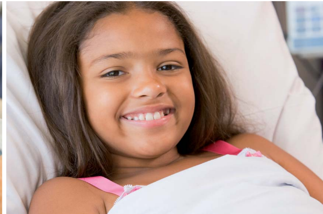
Crianças em idade escolar