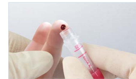
Microvette® 300/500 – Extracción de sangre con el borde de recogida