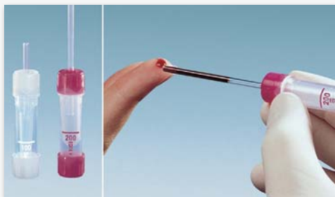
Microvette® 100/200 – Blutentnahme mit End-to-End Kapillare