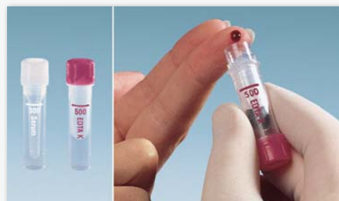
Microvette® 300/500 – Blutentnahme mit dem Abnehmerand

Gerne senden wir Ihnen entsprechendes Informationsmaterial zu.